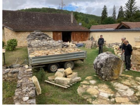
Nouveau stock de lauzes

14 septembre : nettoyage et élagage aux alentours du four par Gilles et Jean-Jacques