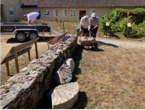
Arrivée des quartiers de meules