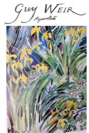
Maison de la Pierre sèche et du Causse DAGLAN Exposition aquarelles et posters 16 Juillet - 31 Août